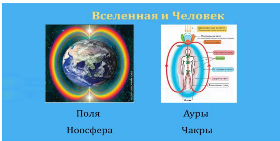
Рис. 2. Структуры связи человека и Земли с внешним миром

«лозопроводцы». А чакры на социоприродном «теле» нашего Экоса являются местом активного взаимодействия человека и ноосферы.