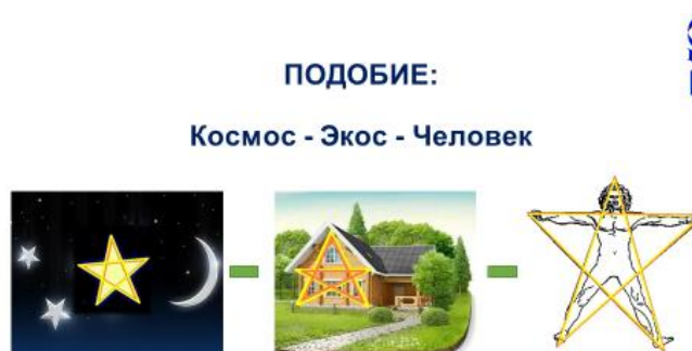
Рис.3. Проявления симметрии в космосе, на Земле и в человеческом теле

И в космосе, и на земле, и в человеческом теле одинаково проявляется принцип симметрии (рис.3). Принцип энергетического (структурного и функционального) подобия является аксиоматическим утверждением энергологии, а его использование позволяет не только понять энергетическое единство Миров-системы, но и прогнозировать ее развитие на основе циклической повторяемости основных этапов и форм энергетического проявления в различных частях этой системы.